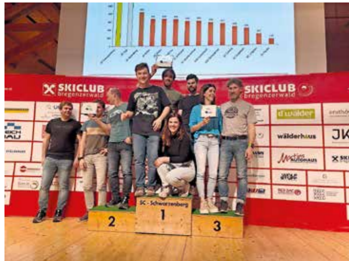
Bei der Siegerehrung des Wäldercups am 5. April im Angelika Kauffmann Saal hat der SC Schwarzenberg zum 7. Mal in Folge den Gesamtsieg errungen.

Für ein besonderes Saison-Highlight sorgte dann wieder einmal unser Star aus der nordischen Szene.