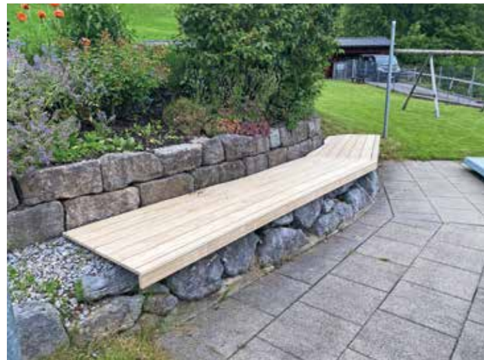
In diesem Jahr wurden zahlreiche Verbesserungen im Schwimmbad vorgenommen, darunter die Erneuerung der Bänke mit frischen Holzplatten.

Das Schwimmbad war in diesem Jahr vom 1. Juni bis zum 8. September 2024 geöffnet. Leider konnten wir aufgrund ungünstiger Wetterverhältnisse vom 1. bis 16. Juni den Betrieb nicht aufnehmen. Dennoch hatten wir in der gesamten Saison 78 Betriebstage, an denen uns eine beeindruckende Anzahl von 16.427 Besucher:innen die Treue gehalten hat. In dieser Saison wurden zahlreiche Verbesserungen vorgenommen, um den Komfort und die Sicherheit unserer Gäste weiter zu steigern. Eine bedeutende Maßnahme war das Entfernen von vier schattenspendenden Bäumen auf der Liegewiese. Es handelte sich um Eschen, die durch einen Pilzbefall stark geschädigt und deren Wurzeln bereits morsch waren. Diese Bäume hätten keinen Schatten mehr gespendet und mussten aus Sicherheitsgründen entfernt werden. Zusätzlich wurde eine neue Schwimmaleine installiert, um den Schwimmer- vom Nichtschwimmerbereich zu trennen. So konnten Besucher:innen ungestört tauchen und spielen, ohne die Schwimmer im Längsbereich zu stören. Sämtliche Bänke wurden mit neuen Holzplatten versehen und der Liegerost im MuKi-Bereich erneuert.