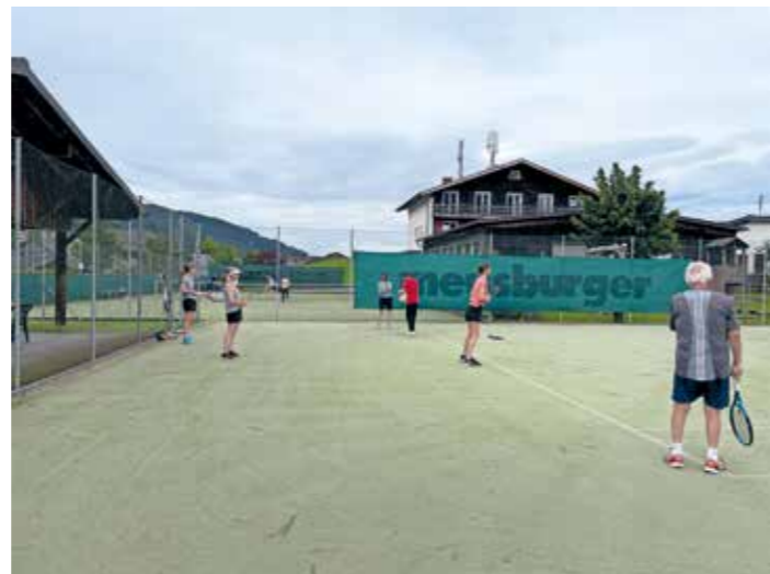
Das offene Training für Neu- und Wiedereinsteiger war ebenfalls sehr beliebt, bei dem erfahrene Clubmitglieder ihr Wissen und Können weitervermittelten.