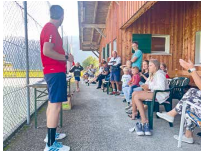
Am 21. September 2024 wurden die Finalis der Vereinsmeisterschaft ausgetragen, mit 42 Teilnehmenden in fünf verschiedenen Wettbewerben.

Besonders gut angenommen wurde auch das offene Training für Neu- und Wiedereinsteiger:innen am Freitagnachmittag, wo erfahrene Clubmitglieder ihr Wissen und Können weitergegeben haben.