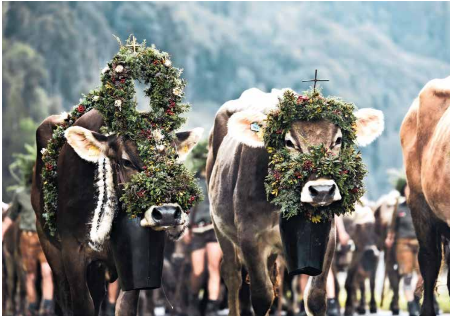
Der traditionelle Blumenschmuck ist nicht nur ein Hingucker, sondern auch ein Zeichen für einen unfallfreien Alpsommer.