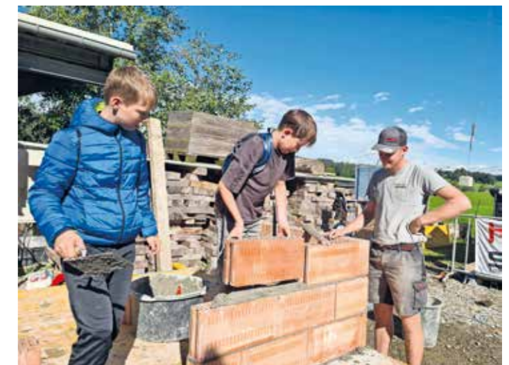
Auf der Lehrlingsmesse in Fahl hatten die älteren Schüler:innen die Möglichkeit, selbst verschiedene praktische Tätigkeiten auszuprobieren.

Nicht der Sport, aber vor allem das handwerkliche Geschick stand bei der Lehrlingsmesse in Fahl im Vordergrund, welche unsere älteren Schüler:innen im September besuchten. Dabei stellten zahlreiche Betriebe ihre Arbeit vor und die Jugendlichen hatten die Möglichkeit, selbst verschiedene Dinge auszuprobieren. Wir danken den einzelnen Betrieben für die Möglichkeit des Hineinschnuppens und vor allem auch den Organisatoren.