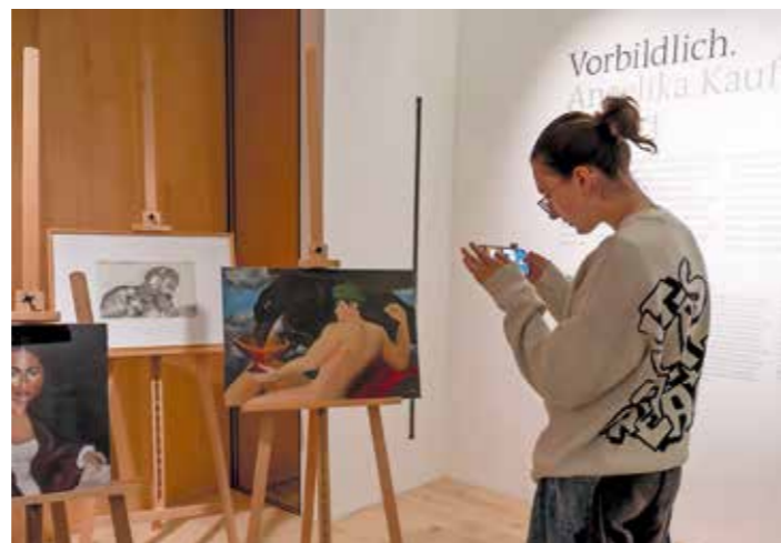
Eine Auswahl der besten künstlerischen Arbeiten von Schüler:innen des BORG Egg wurde in der Ausstellung präsentiert.