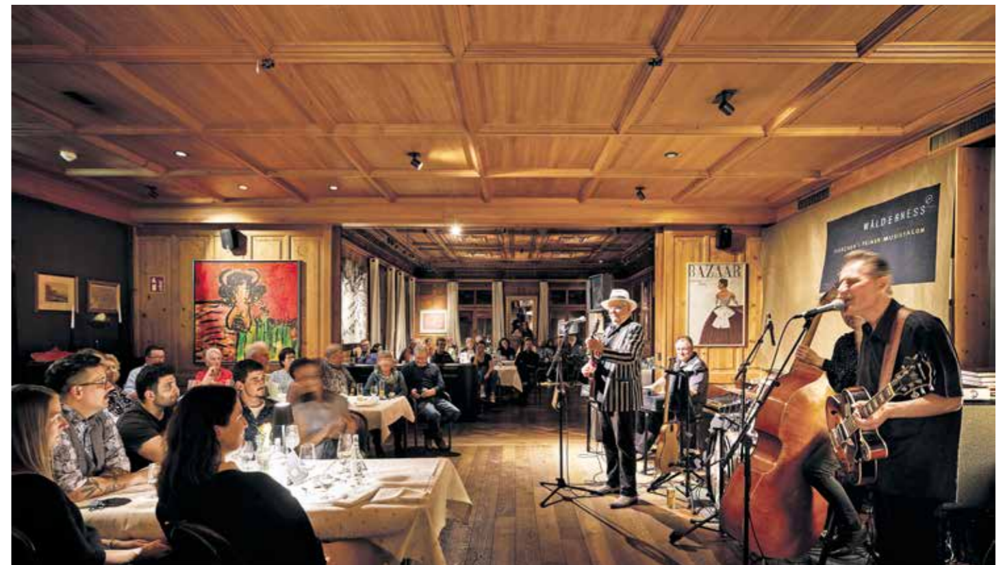
Der kultige Musiksalon Wälderness geht in die nächste Runde.