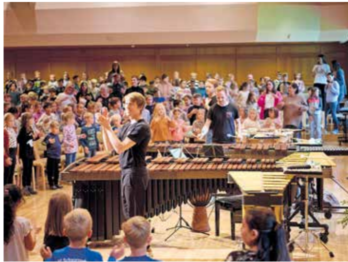
Durch Schulkonzerte und Schulbesuche erreichte die :alpenarte zudem rund 600 Kinder und Jugendliche aus der Region.

Die :alpenarte bot ein abwechslungsreiches Programm von Klassik über Jazz bis zu Uraufführungen und erreichte mit Schulkonzerten und Schulbesuchen zusätzlich knapp 600 Kinder und Jugendliche der Region. Wir freuen uns auf das nächste Jahr vom 9. bis 12. Oktober 2025!