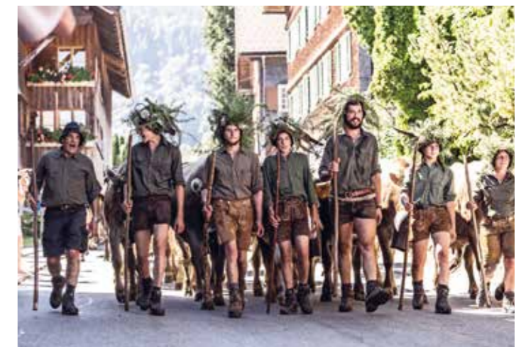
Die Äpler:innen der Alpe Mittelargen kamen strahlend im Dorfkern an und blickten zufrieden auf einen gelungenen Alpsommer zurück.