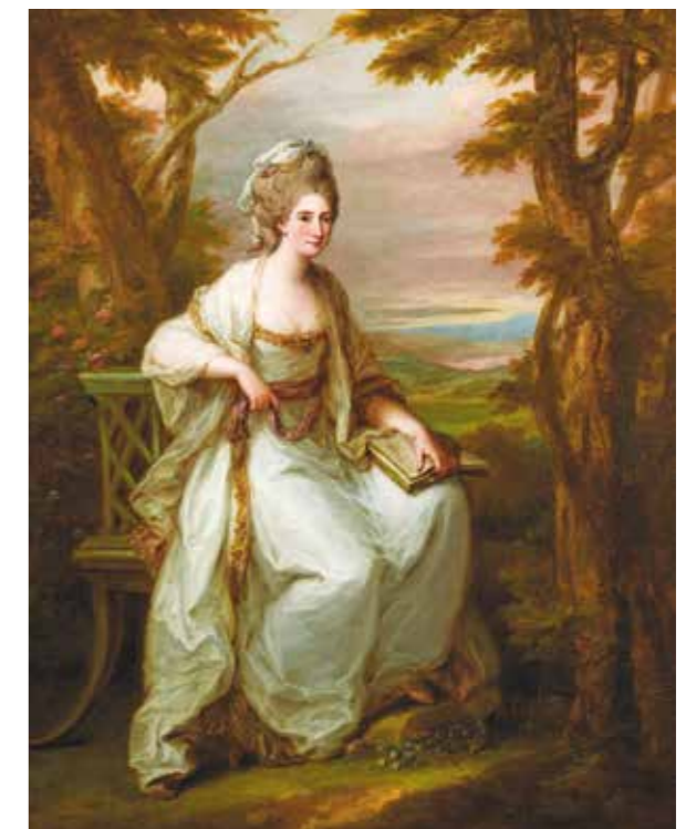
Angelika Kauffmann, Lady Henderson of Fordell, 1771, Angelika Kauffmann Museum Schwarzenberg

Kleider machen Leute – das wusste auch Angelika Kauffmann (1741–1807), die als begehrte Porträtmalerin das öffentliche Bild zahlreicher Persönlichkeiten ihrer Zeit nachhaltig prägte. Kauffmann verstand es nicht nur, das ganze Wesen der Dargestellten lebensnah einzufangen, sondern verfügte auch über ein großes Gespür für modische Trends. Wer sich von ihr porträtieren ließ, vom It-Girl bis zum Gelehrten, konnte sich sicher sein, von Kopf bis Fuß perfekt gestylt zu erscheinen, während die Künstlerin mit der täuschend echten Wiedergabe kostbarer Stoffe gleichzeitig ihr malerisches Können unter Beweis stellte. Kauffmanns Gemälde sind faszinierende Zeugnisse der Modegeschichte. Sie dokumentieren eine Ära der kulturellen und politischen Umbrüche, geprägt durch die Aufklärung, den internationalen Handel, Reisen, technologischen Fortschritt und außereuropäische Einflüsse. Dies trifft ebenso auf die Selbstbildnisse der Künstlerin zu, in denen sie mittels Kleidung, Schmuck und Frisur ihre Herkunft, Identität und gesellschaftliche Stellung thematisiert und die verschiedenen Stationen ihres Lebens und ihrer Karriere reflektiert.