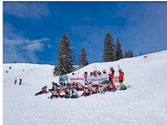
Trotz einiger Herausforderungen konnte der SC den Schwarzenberger Mini-Weltcup erfolgreich durchführen.

Auch unsere Rennserie, den Schwarzenberger Mini-Weltcup, konnten wir, wenn auch sehr mühsam, wieder durchführen. Die Rennen 1 und 2 starteten wir als Abschluss der Weihnachtsferien am 7. Jänner am Bödele. Für die Rennen 3 und 4 mussten wir dann leider an den Diedamskopf ausweichen.