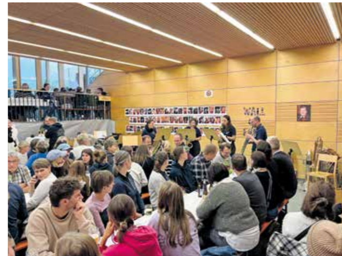
Trotz der unbeständigen Wetterverhältnisse gaben alle Beteiligten ihr Bestes, wodurch ein erfolgreicher Markt realisiert werden konnte.