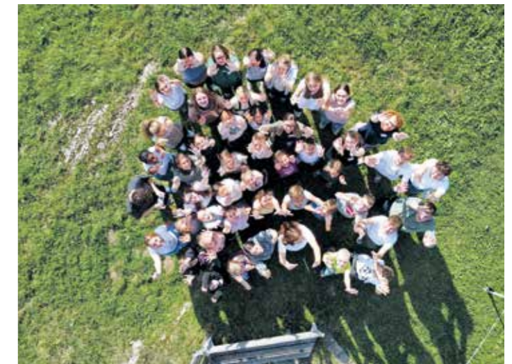
Einmal im Monat findet eine besondere „Probe +“ statt, bei der neben der musikalischen Arbeit vor allem der Spaß im Mittelpunkt steht.