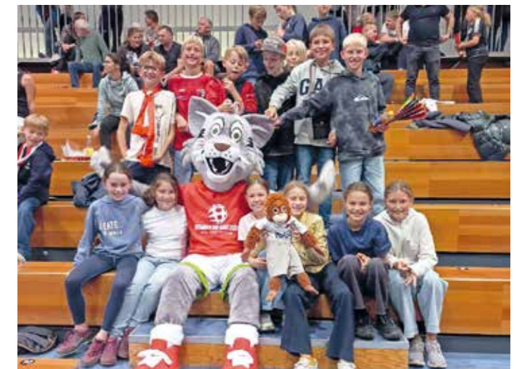
Die WIN-Sportler:innen besuchten das Handballspiel der österreichischen Frauennationalmannschaft gegen das Team aus Nordmazedonien.

Unsere WIN-Sportler:innen durften Ende September schon ein erstes Highlight erleben: Sie fuhren gemeinsam mit den Lehrpersonen auf das Handballmatch der österreichischen Frauennationalmannschaft gegen die Auswahl aus Nordmazedonien. Es war ein richtig tolles Erlebnis für unsere Kids und wir wissen nun auch, dass ihr echt gute Schlachtenbummler:innen seid!