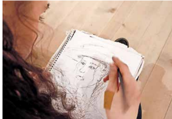
Die Schüler:innen im Kunstraum beim „Kopieren“ der Werke.

Den Abschluss des Projekts bildete die feierliche Präsentation anlässlich der „Langen Nacht der Museen“ und die Möglichkeit für die jungen Talente, ihre Werke in den eindrucksvollen Räumlichkeiten des Museums auszustellen.