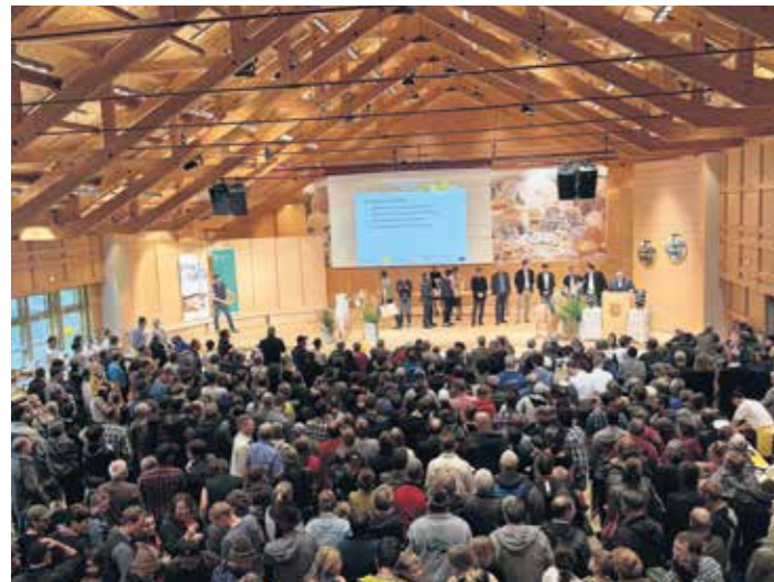
Bei der Siegerehrung, die um 13 Uhr im Angelika Kauffmann Saal stattgefunden hat, war der Saal bis auf den letzten Platz gefüllt.

Folgende Schwarzenberger Senner:innen bzw. Schwarzenberger Alpen wurden prämiert: