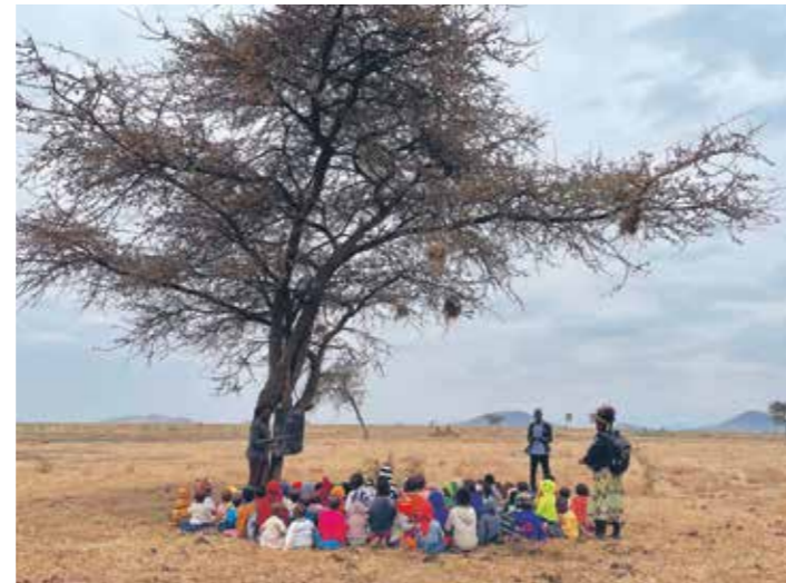
Als die beiden sahen, dass die Kinder auf dem Feld unter einem Baum unterrichtet wurden, war ihnen sofort klar, dass sie das ändern wollen.