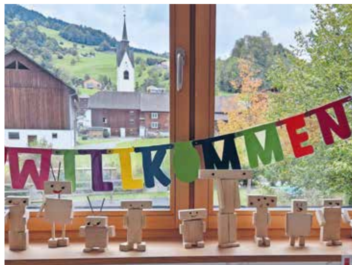
In diesem Schuljahr besuchen insgesamt 92 Schülerinnen und Schüler die Volksschule in Schwarzenberg, die auf fünf Klassen verteilt sind.

Wir freuen uns, dass das Schuljahr wieder gut angelaufen ist. Alle Schülerinnen und Schüler wurden herzlich empfangen und haben sich schnell in ihren Klassen eingelebt. Wir unterrichten in diesem Schuljahr 92 Schülerinnen und Schüler in fünf jahrgangsgemischten Klassen.