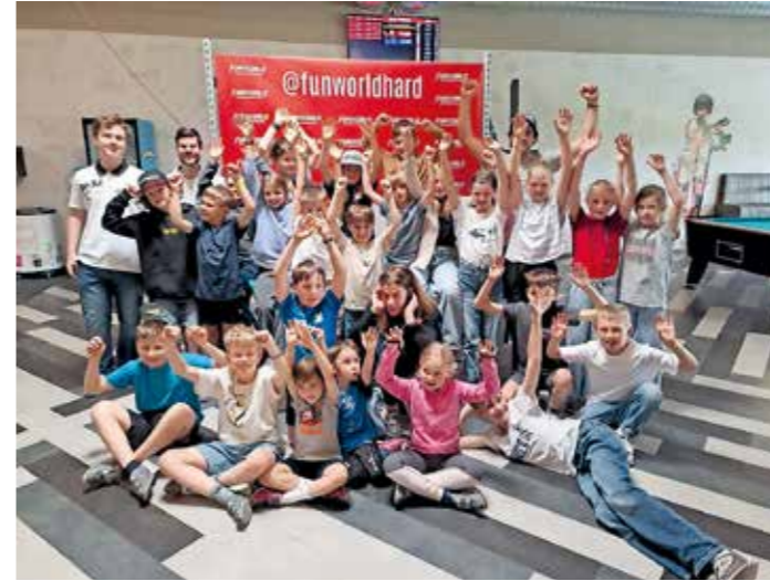
Beim Abschluss am 17. Mai hatte die Trainingsgruppe samt Trainer viel Spaß in der Funworld in Hard.

Beim Abschlussnachmittag am 17. Mai vergnügten sich unsere Trainingsgruppe samt Trainern in der Funworld in Hard, bevor dann alle auf der Mini-Weltcup Siegerehrung noch mit einem Schiclub T-Shirt weiß eingekleidet wurden.