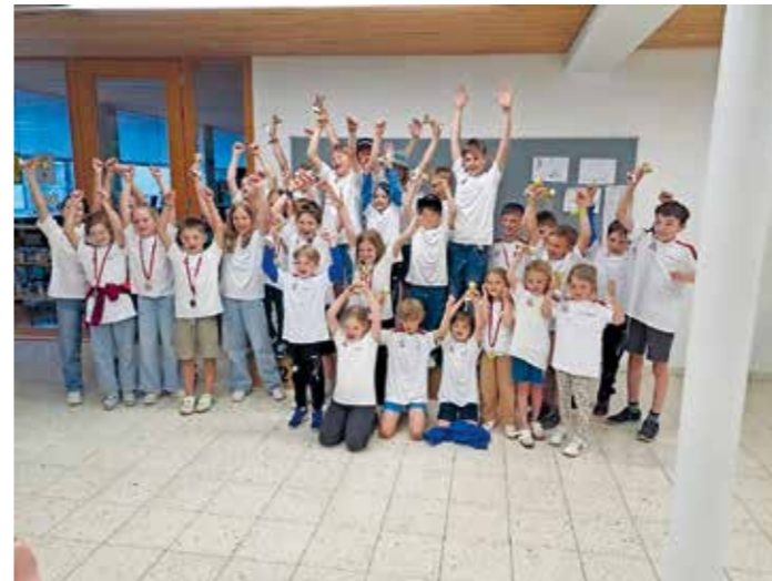
Bei der Mini-Weltcup-Siegerehrung wurden alle Läufer:innen mit einem weißen Schiclub-T-Shirt eingekleidet.

Die beiden Wäldercuprennen Nr. 3 + 4 am 17. Februar, welche von uns durchgeführt wurden, mussten wir leider notgedrungen von Schwarzenberg nach Damüls verlegen.