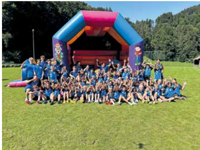
Das Fußball-Camp des FC Schwarzenberg Nachwuchts war heuer wieder ein voller Erfolg. Über 60 Kids vom FCS nahmen daran teil.

Bekleidungs-Sponsoren: MEVO, Steurer Siegfried Installationen/Energietechnik, Raiffeisenbank Mittel- und Hinterbregenerwald, Rent4Ski, Wolf Metall, Nold, M-Bau, Prock Blitzschutz