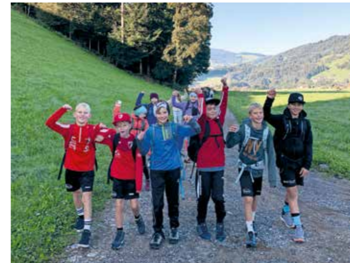
In der zweiten Schulwoche nutzten die Klassen den Herbstwandertag, um die Gemeinschaft zu stärken.

Wir sind gut ins neue Schuljahr gestartet und nun ist schon wieder einiges los an der MS Egg. Unsere Jüngsten durften sich schon in der ersten Woche beim Kennenlerntag mit Spiel und Spaß näher kennenlernen. In der zweiten Schulwoche fand der Herbstwandertag bei traumhaftem Wetter statt. Auch dies ist eine gute Möglichkeit, die Klassengemeinschaft zu stärken und gemeinsam eine schöne Zeit zu erleben. Die Ziele waren wie jedes Jahr sehr unterschiedlich und reichten vom Hittisberg, über den Quelltuff, bis hin zum Brüggelekopf.