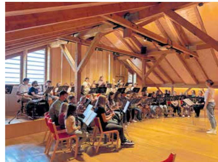
Die Jungmusik Mittelwald wurde in Zusammenarbeit mit den Musikvereinen Egg, Großdorf und Harmonie Andelsbuch gegründet.

Den Auftakt bildete ein Kennenlern- und Probentag in Schwarzenberg. Nach einer herzlichen Begrüßung wurden ein paar Kennenlernspiele gespielt, bevor dann schon die erste Gesamtprobe stattfand. Kreative Bastelarbeiten und Registerproben, geleitet von Musikant:innen der beteiligten Vereine, rundeten den Vormittag ab. Mittags stärkten sich alle mit Familienpizza, Leberkäsesemmeln und Limo, bevor es in die zweite Gesamtprobe ging. Trotz voller Bäuche verflieg die Zeit in der Probe im Nu. Ein Spaziergang zur Angelikahöhe bot Gelegenheit, das Mittagessen zu verdauen und ein gemeinsames Gruppenfoto zu machen. Zum krönenden Abschluss des Tages präsentierten die Jungmusikant:innen im kleinen Dorfsaal ihr erstes Konzert, das von vielen Eltern und Geschwistern mit Begeisterung verfolgt wurde.