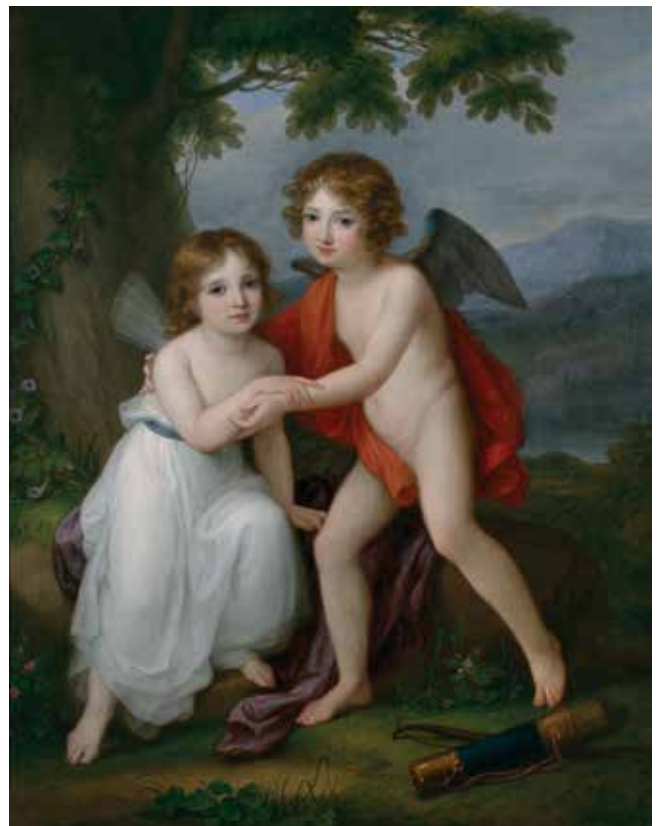
Bildnis der Geschwister Plymouth als Amor und Psyche, 1795, Öl auf Leinwand

In Kooperation mit der Musikschule Bregenzwald