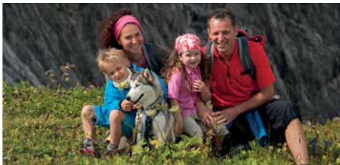
Familien Spaß mit der V-CARD

Das Familien Forum Brandnertal richtet sich speziell an Eltern, Großeltern, Familienangehörige und pädagogisch Interessierte. Zum Thema „Mensch + Natur“ werden neben Prof. DDr. Manfred Spitzer noch weitere hochkarätige Dozenten ihr Wissen in Fachvorträgen und praktischen Workshops an die Teilnehmer weitervermitteln. Mit diesem Kongress geht das Brandnertal als familienfreundlichste Destination in Vorarlberg einen Schritt weiter und engagiert sich direkt für die Anliegen, Bedürfnisse und Interessen der Familien.